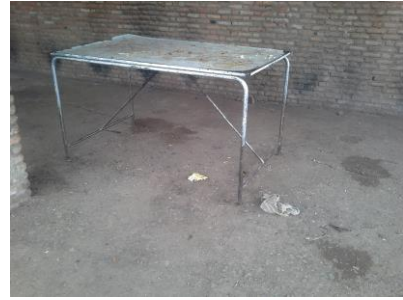
Un réfectoire sans chaise ni pupitre