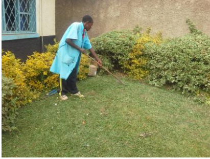
Un travailleur sans équipement adéquat